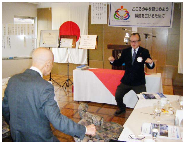
戸澤会長に「大丈夫」とエールを送る

第1676回例会 2012.3.1 曇り 司会 大原会員 国歌「君が代」 ロータリーソング「奉仕の理想」